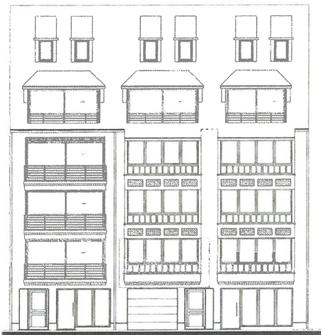
GEVEL PAUL PARMENTIERLAAN